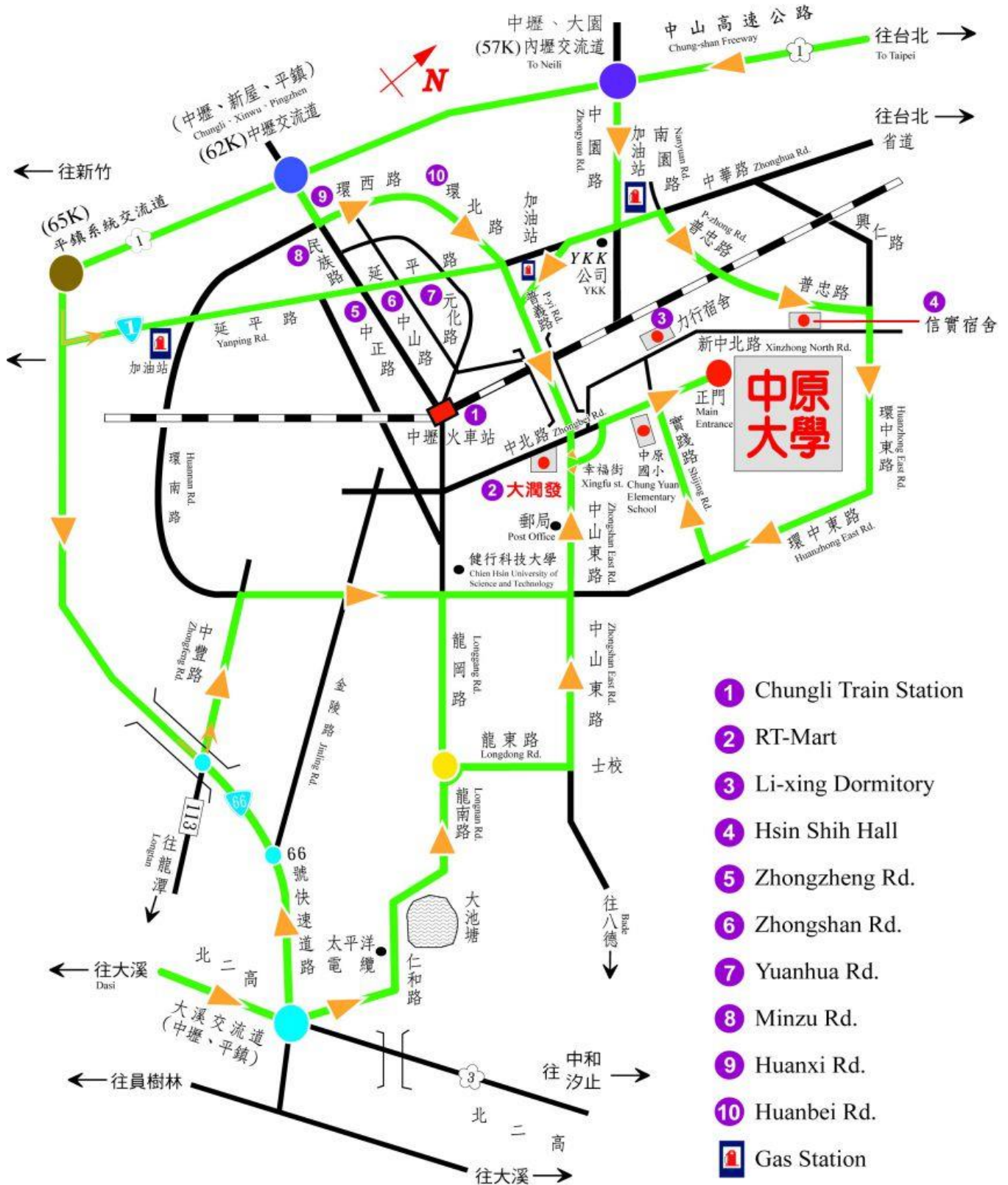
Chung Yuan Christian University Direction Sign Map