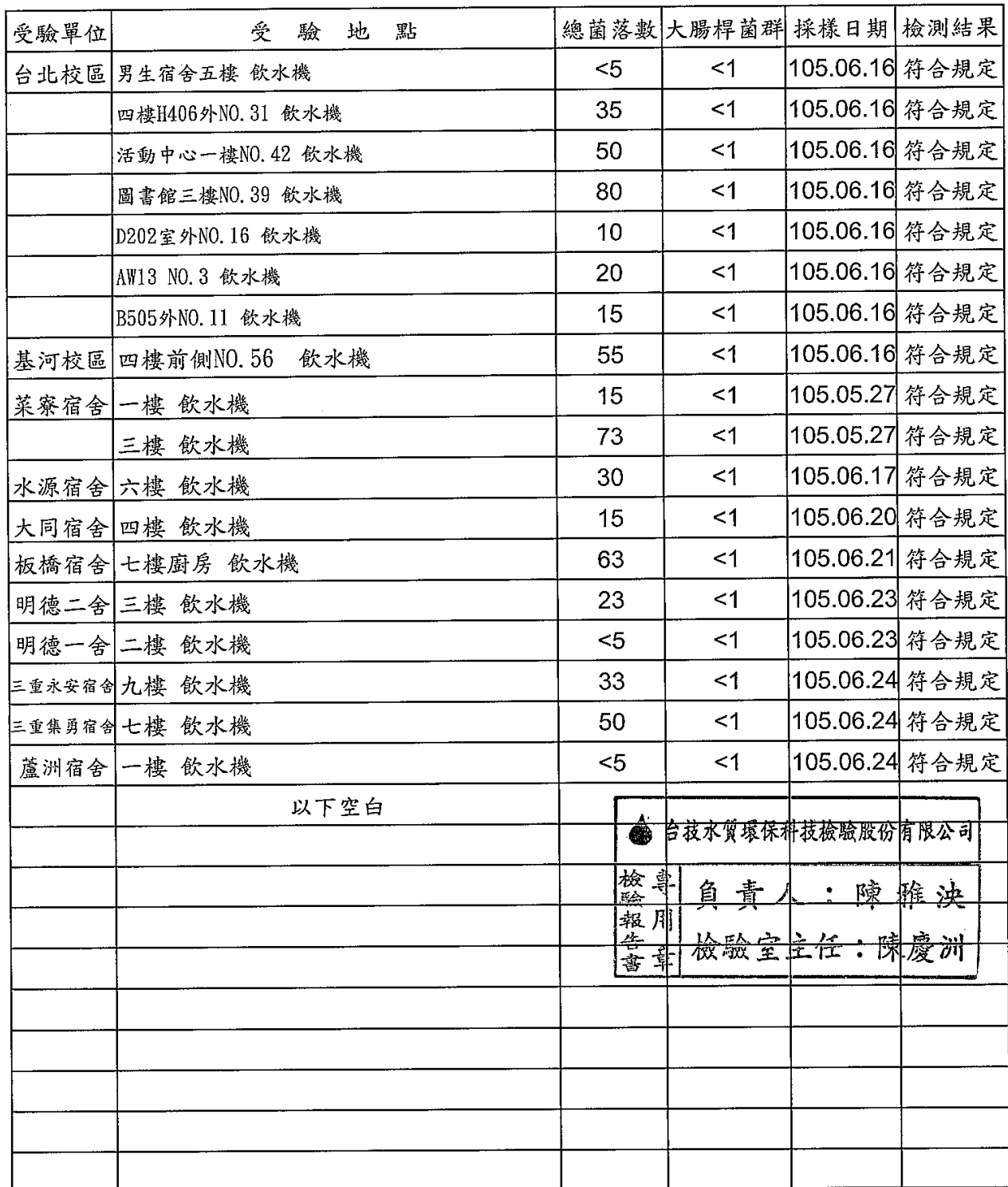
銘傳大學水質檢驗結果一覽表