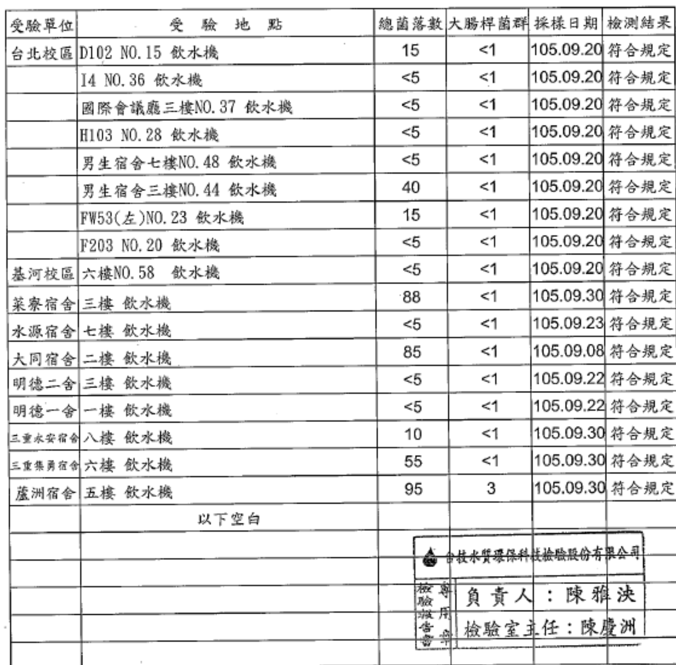
銘傳大學水質檢驗結果一覽表