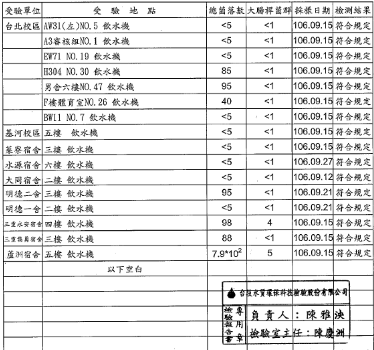
銘傳大學水質檢驗結果一覽表